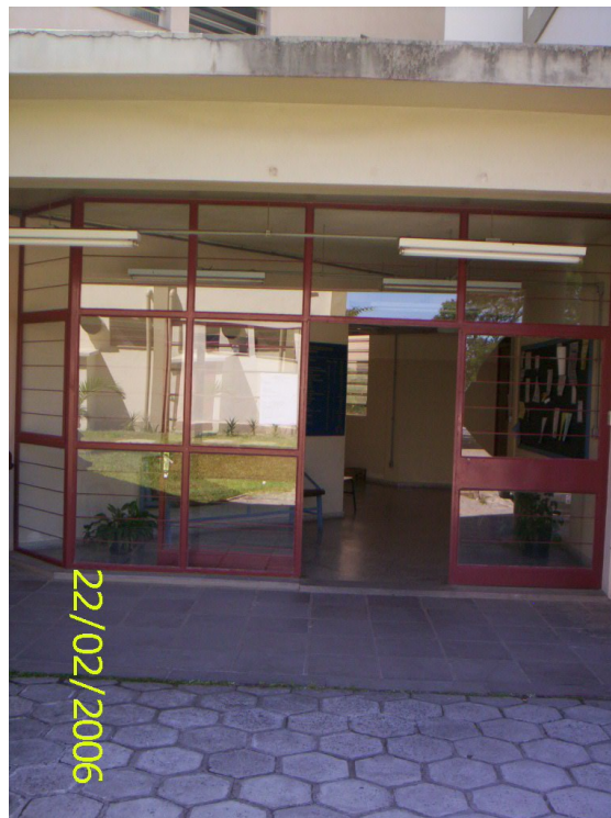
Figura 36 – Porta de entrada (fundos) do CE