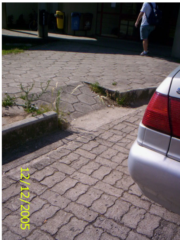
Figura 44 – Carro estacionado obstruindo rampa de acesso do Centro de Educação