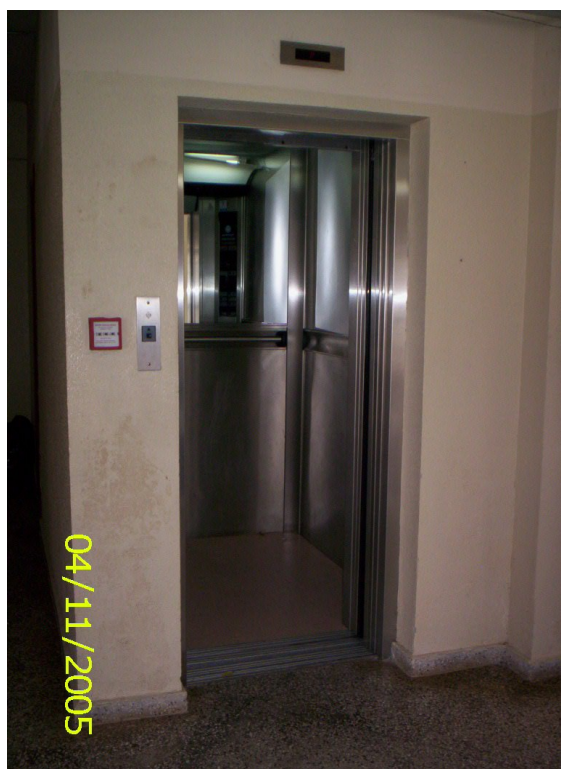
Figura 37 – Elevador do prédio do CE