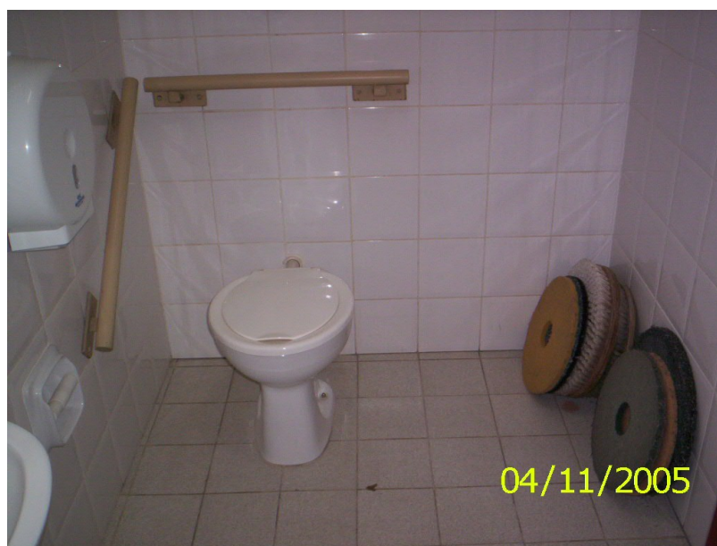
Figura 39 – Banheiro adaptado do CE com material de limpeza depositado