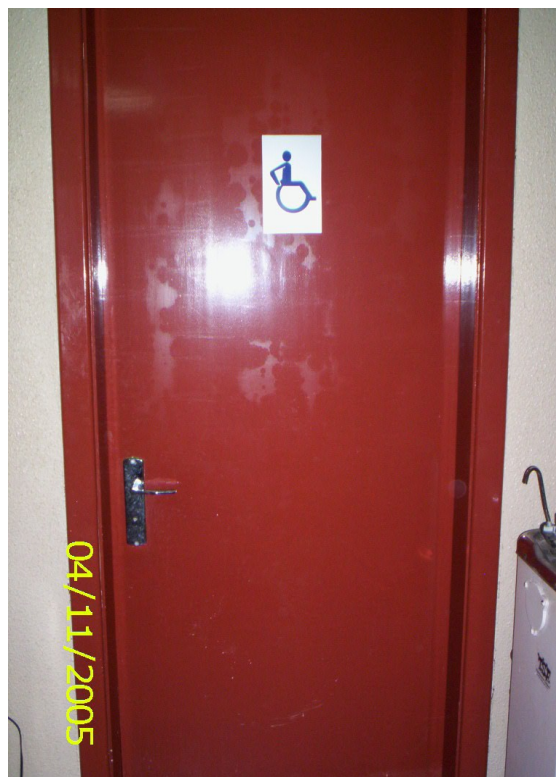
Figura 38 – Porta de banheiro adaptado do CE