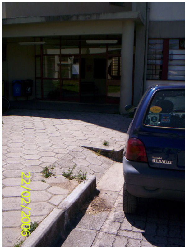
Figura 43 – Carro estacionado obstruindo rampa de acesso do Centro de Educação