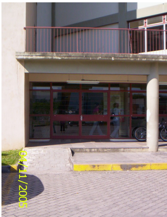
Figura 35 – Rampa de acesso ao CE