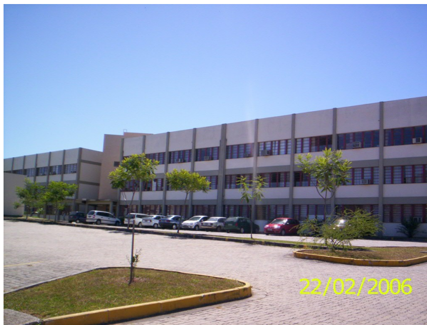
Figura 40 – Prédio do Centro de Educação – Acesso ao Curso de Letras