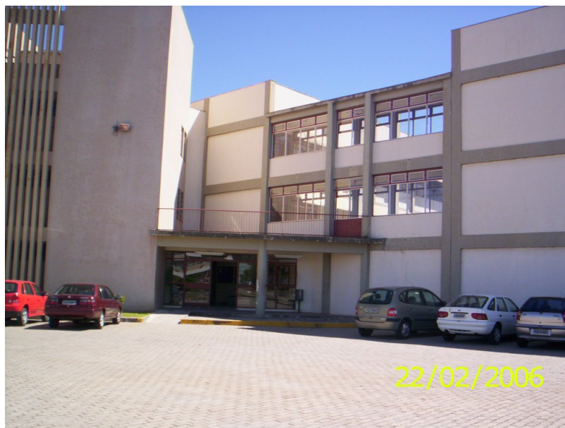
Figura 33 – Prédio da Unidade VI – Centro de Educação (CE) – Entrada posterior