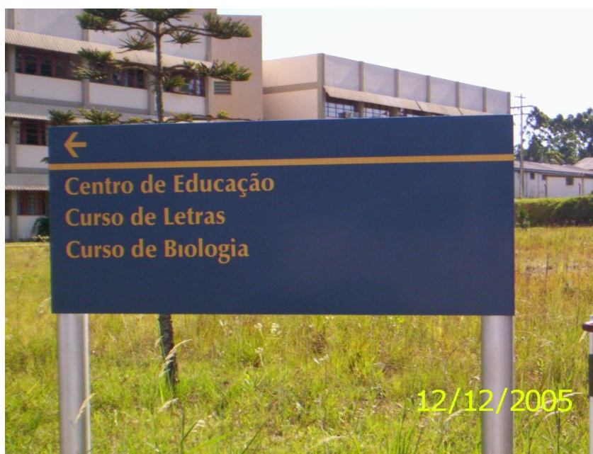
Figura 41 – Placa indicativa do Centro de Educação