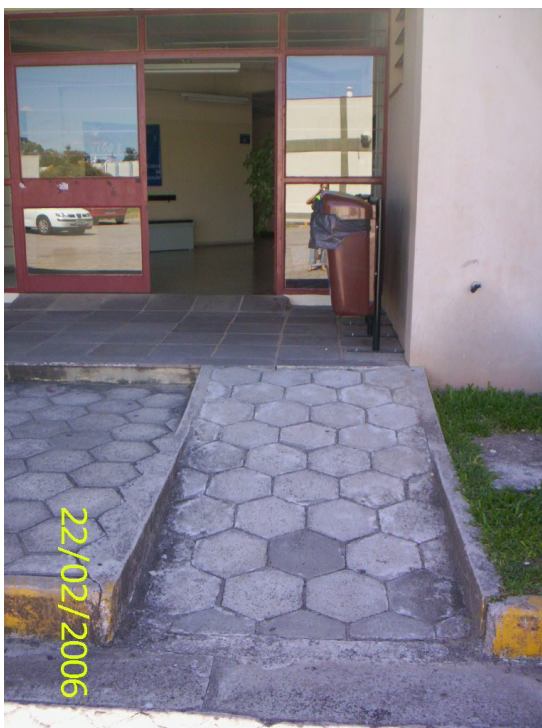
Figura 42 – Rampa de acesso do Centro de Educação obstruída por lixeira