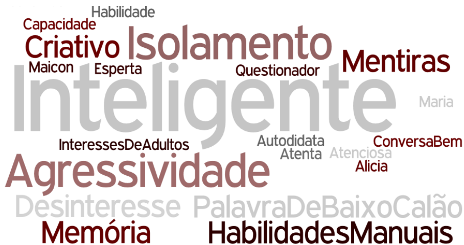
Figura 4 – Nuvem de Palavras - expressão “Criança com altas habilidades/superdotação”.

Na categoria altas habilidades/superdotação, é encontrada a subcategoria “criança/estudante com altas habilidades/superdotação” . Para as profissionais da Instituição de Acolhimento, a expressão indutora remeteu à palavra “inteligente”. Segundo a versão online do dicionário Aurélio (AURÉLIO, 2014), inteligente é atributo de quem tem inteligência; 1) Conjunto de todas as faculdades intelectuais (memória, imaginação, juízo, raciocínio, abstração e concepção); 2) Qualidade de inteligente; 3) Compreensão fácil; 4) Pessoa muito inteligente e erudita; 5) Harmonia; 6) Habilidade.