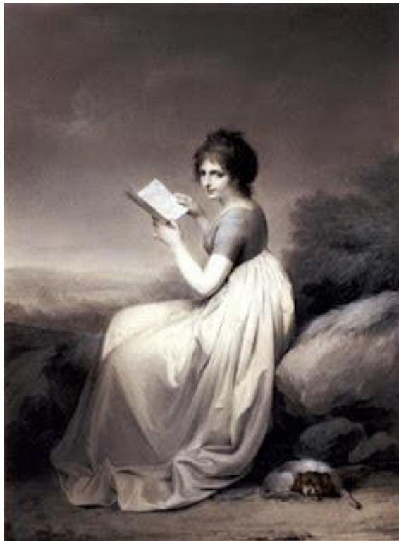
Figura 2– Louis Leopold Boilly – Jovem lendo em uma paisagem (1798) The Hood Museum of Art.

Não há ensino sem pesquisa e pesquisa sem ensino. Enquanto ensino, continuo buscando, (re)procurando. Ensino porque busco, porque indaguei, porque indago e me indago. Pesquiso para constatar, constatando, intervenho, intervindo, educo e me educo. Pesquiso para conhecer o que ainda não conheço e comunicar ou anunciar a novidade (FREIRE, 1997, p. 32).