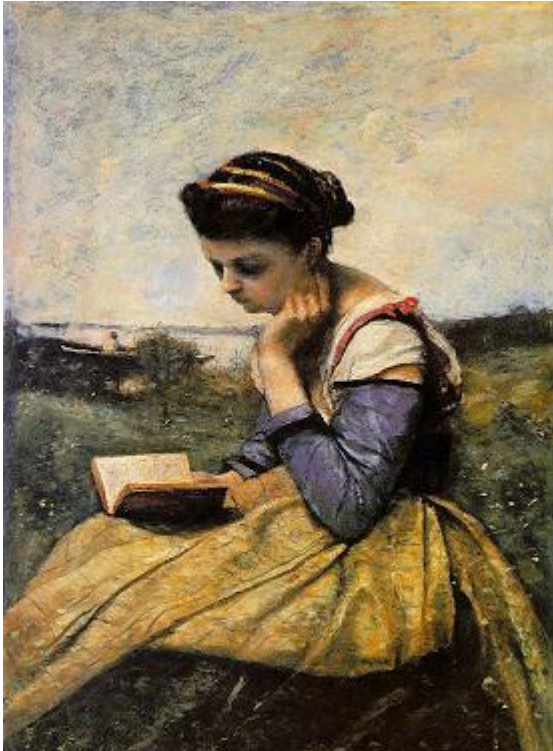
Figura 3 – Corot - Mulher lendo na paisagem (1869) The Metropolitan Museum of Art, Nova York.

Em suma, não se pode observar uma onda sem levar em conta os aspectos complexos que concorrem para formá-la e aqueles também complexos a que dá ensejo. Tais aspectos variam continuamente, decorrendo daí que cada onda é diferente de outra; mas da mesma maneira é verdade que cada onda é igual a outra onda, mesmo quando não imediatamente contígua ou sucessiva; enfim, são formas e sequências que se repetem, ainda que distribuídas de modo irregular no espaço e no tempo. (CALVINO, 1994, p. 08)