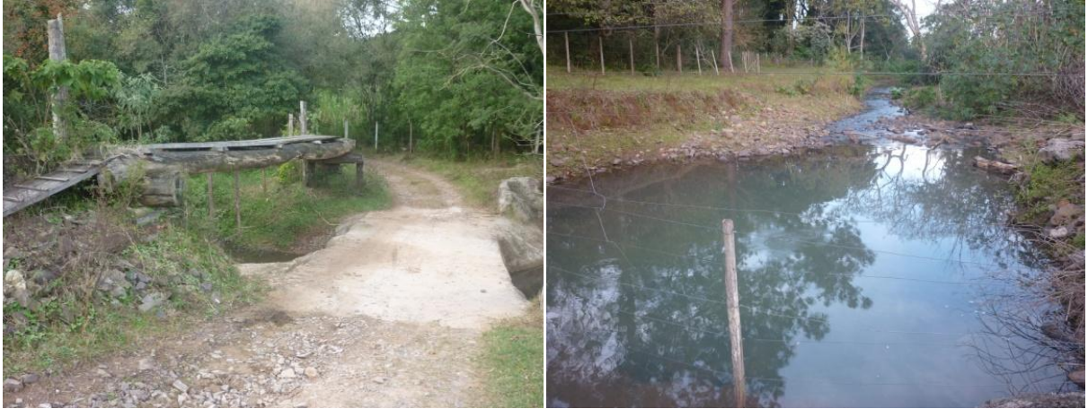
Figura 3: Ponto 1 de coleta

ciliar, porém não apresenta-se muito densa, como pode ser visualizado na figura (3). A água apresentava-se transparente e sem cheiro.