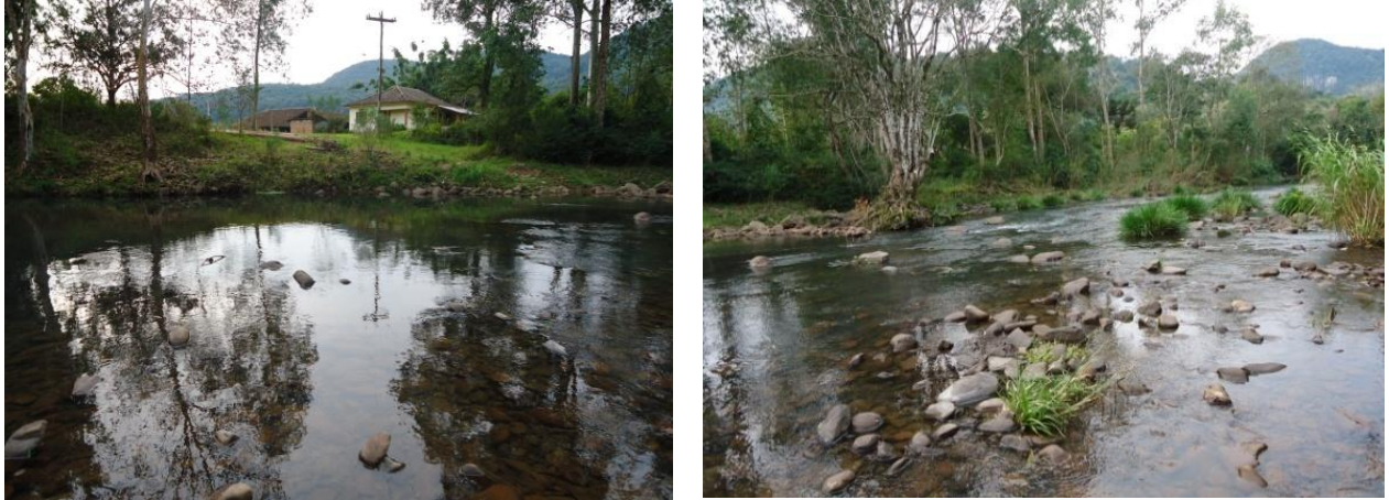
Figura 5: ponto 3 de coleta

O ponto 3 (P3) localizado a 29^{\circ}36'30.04'' S e 53^{\circ}41'56.13'' O, 115 m de altitude zona rural do município, a coleta foi realizada nas proximidades de uma ponte. A água neste ponto apresentava-se transparente e sem nenhum odor. (figura 5).