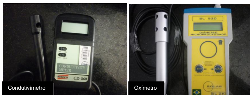
Figura 7: Equipamentos de análise

O aparelho é ligado, durante aproximadamente 10 minutos. Após, a sonda de condutividade elétrica é lavada com água destilada e enxugada com papel absorvente macio. O equipamento é calibrado com solução padrão de condutividade elétrica de 146,9 \mu\text{s}/\text{cm} . Lavar e enxugar novamente a sonda. Proceder a leitura de condutividade elétrica da amostra conforme estabelecido pelo fabricante. Após a leitura da amostra, lavar o eletrodo e guardar conforme especificação do fabricante.