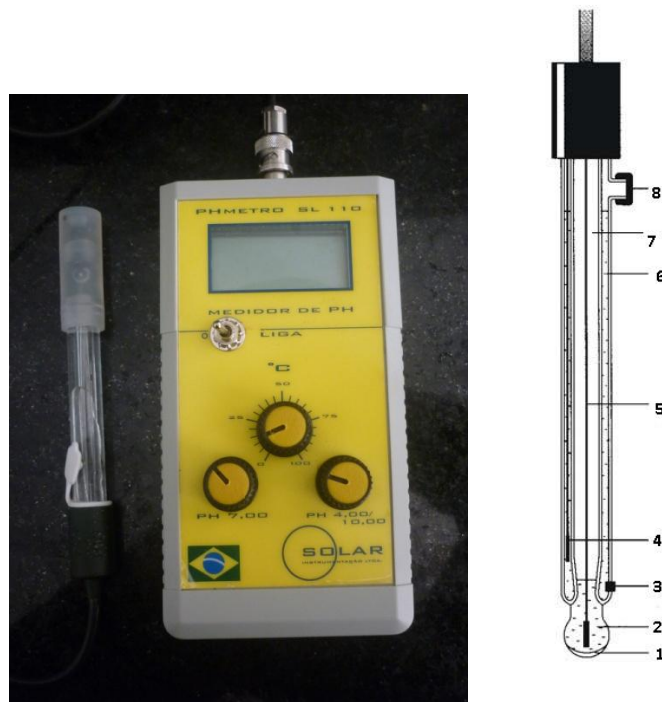
Figura 8: Peagômetro utilizado em campo

Antes de realizar as medições de pH das amostras, os peagômetros devem ser calibrados com solução tampão pH. O ajuste pode ser feito com duas soluções padrões (pH 4 e 7 ou 7 e 10).