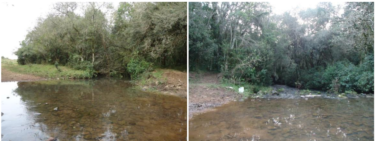
Figura 6: Ponto 4 de coleta

O Ponto 4 (P4) localizado a 29^{\circ}29'05.65'' S e 53^{\circ}42'55.85'' O, 502m de altitude, encontra-se em uma propriedade rural, com uma área de agricultura bastante representativa e presença de gado. A mata ciliar apresenta-se um pouco mais densa e a água com coloração transparente sem nenhum tipo de odor. O local é utilizado para dessedentação dos animais (figura 6)