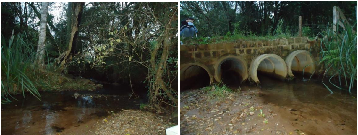
Figura 4: Ponto 2 de coleta

Ponto 2 (P2) localizado a 29^{\circ} 36'53.38'' S e 53^{\circ}45'35.94'' O e 402m de altitude. Este ponto recebe carga de esgoto, pois está inserido na zona urbana do município de Itaara. A amostra foi coletada após o boeiro figura (4), construído para passagem de veículos e pessoas. Apesar da coloração da água estar transparente havia um odor de esgoto, não detectado nos demais pontos.