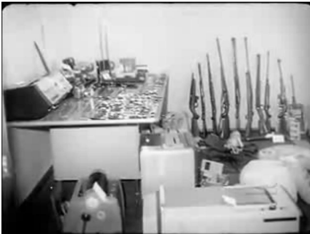
Imagem 3. Armamento apreendido no “aparelho” de Dimas Casemiro, em 17 de abril de 1971.

esclarecida. No seu “aparelho” foram encontrado um verdadeiro arsenal, com diversos rifles, metralhadoras, projéteis, granadas fabricadas à mão, pistolas e revólveres, como visto na Imagem 3.